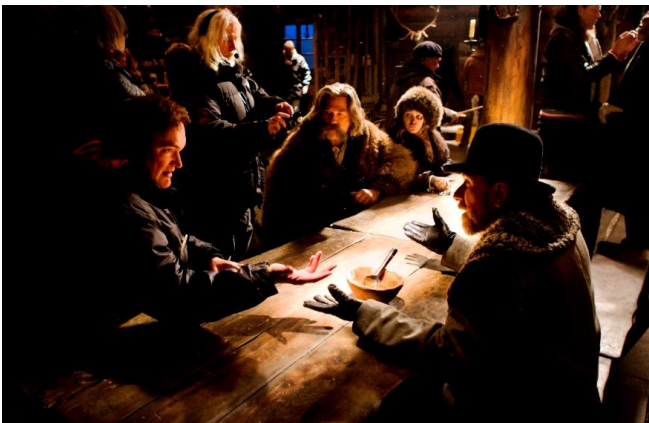
セットでのタランティーノ監督と俳優の打合せ

撮影場所にはワイオミング州、ユタ州、コロラド州が候補にあがっていた中で、タランティーノ監督が描いていたイメージとぴったり一致したのがテリュライドでした。切り立った崖に挟まれた深い峡谷から望むサンワン山脈の絶景が決め手となりました。プロデューサーのシャノン・マッキントッシュ氏も「ウィルソンメサがあまりにもきれいで、ここで撮影をしないわけにはいかないと感じた。」と語っています。コロラド州内には フォーティナーズ (14ers) と呼ばれる 14,000 フィートつまり 4,200 メートル級の山々が 58 座あります。そのうちの 14 座がテリュライド周辺にあり、全米で最も集中している地域であることから、正に壮麗な景観が広がっています。