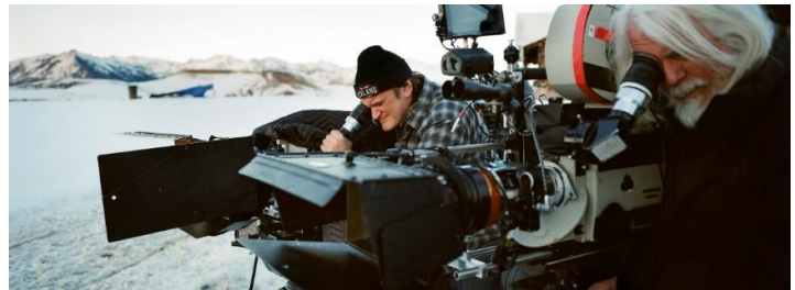
テリュライドの山々を背に制作にあたるタランティーノ監督

来る2月27日に全国ロードショーが始まるクエンティン・タランティーノ監督の映画『ヘイトフル・エイト』は、コロラド州南西部の街、テリュライドの西16kmに位置するウィルソンメサで撮影されました。数々のシーンの背景に、コロラドの雄大な山々や林立するアスペンの木々など、この地域の美しい大自然が映し出されます。