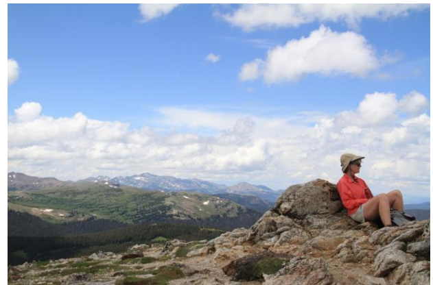
トレイルリッジロード沿いのハイキングコースも人気

ハイキングや星空観測、園内に生息する動物について学ぶものなど、パークレンジャーによる様々なプログラムが開催されます。詳しくは公園発行の ニュースレター で確認してください（2018年夏号は6月に発行予定）。