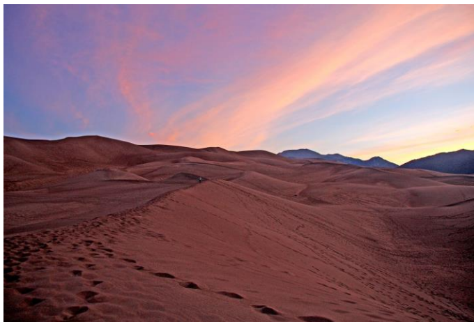
朝焼けの砂丘も美しい

■ グレートサンドデューンズ国立公園 ：多くの人が抱くロッキー山脈のイメージとは全く異なる風景が広がる公園。北米で最も標高の高い所にある砂丘で、ビジターセンターの地点でもすでに2,492メートルあります。ハイキングの他に、砂丘を滑り降りて行くサンドボードや、雪解け水によって初夏に出現する小川メダノクリークで水遊びが楽しめます。