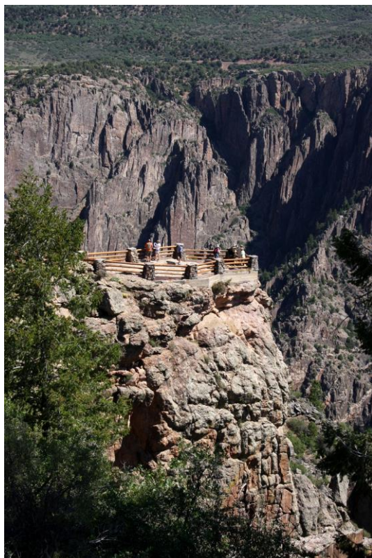
展望ポイントで迫力の岩壁に見入る

それぞれ異なるユニークな地形や魅力に満ちたコロラド州の4つの国立公園。これから人気のシーズンを迎えます。詳細は各公園のウェブサイトでご確認ください。